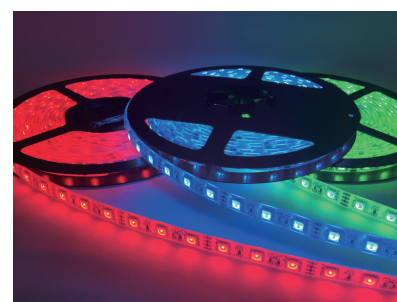
参考写真イメージ